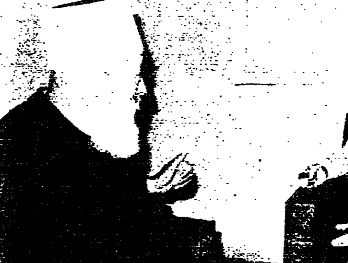
الرئيس امس وسلمه نسخ الملغ اثنا اجتماعها امس